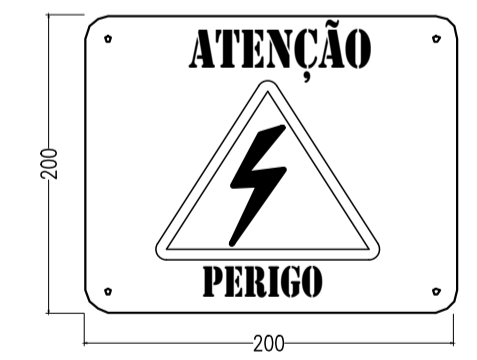
3 PLACA DE ADVERTÊNCIA NA PORTA DO QDFL (NR10)