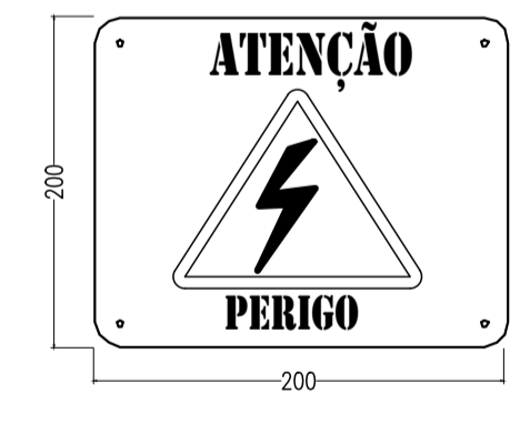
3 PLACA DE ADVERTÊNCIA NA PORTA DO QDFL (NR10)